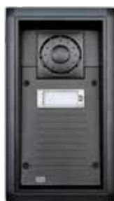
2N® Analog Force

Díky využití služeb stávající analogové ústředny šetří nejen náklady na nové řešení, ale nabízí i dokonalejší a širší služby, např. přesměrování v době nepřítomnosti (na jiné pracoviště, na záznamník, apod.) nebo přepojení hovoru (např. ze sekretariátu na požadovanou konkrétní osobu).