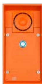
2N® Analog Safety