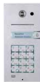
2N® Analog Vario