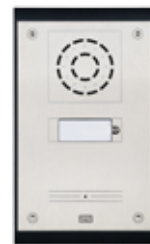
2N® Analog Uni