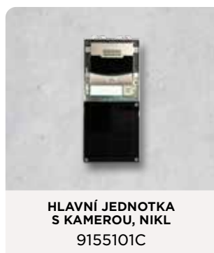
HLAVNÍ JEDNOTKA S KAMEROU, NIKL 9155101C