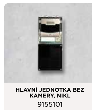
HLAVNÍ JEDNOTKA BEZ KAMERY, NIKL 9155101